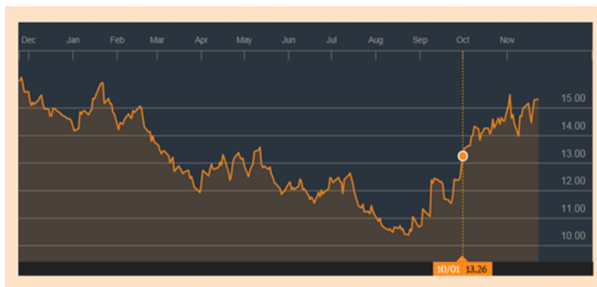
Contrato # 11

El precio internacional del azúcar, del Contrato No. 11, se ubicó en 13.26 centavos de dólar por libra, el cual venía de 12.28 centavos de dólar por libra. Aunque el precio tiene sus altibajos, no han sido relevantes, puesto que la tendencia persiste a la baja.