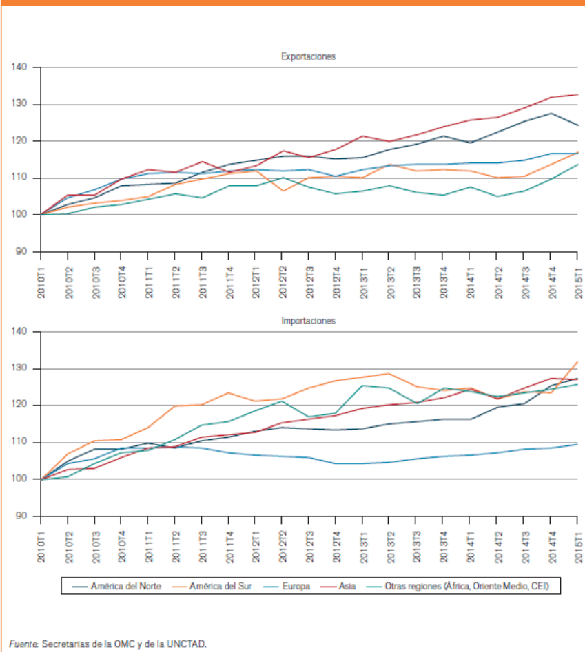
Gráfico 4: Volumen de exportaciones e importaciones de mercancías, por regiones, primer trimestre de 2010 a primer trimestre de 2015 (Índices de volumen desestacionalizados, 2010T1=100)

Varios factores contribuyeron a la desaceleración del comercio y la producción en 2014 y a principios de 2015, entre ellos un crecimiento más lento del PIB en las economías emergentes, la desigual recuperación en los países desarrollados y las crecientes tensiones geopolíticas. Las acusadas fluctuaciones de los tipos de cambio, incluida la apreciación del dólar de los Estados Unidos (14%) frente a otras monedas entre julio y marzo, han complicado aún más la situación y las perspectivas del comercio.