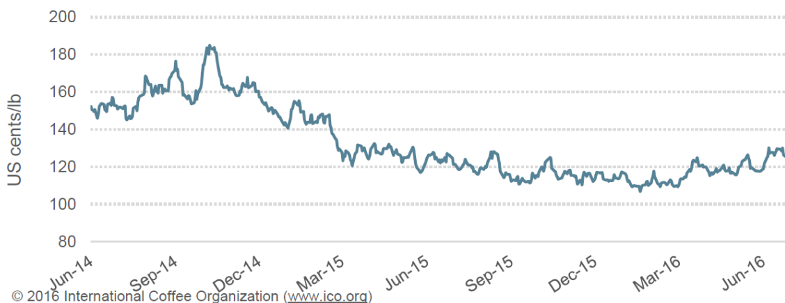
Gráfico 1: Precio indicativo compuesto diario de la OIC

El consumo de café aumenta y los precios en el mercado son los más elevados en 14 meses. En el mes de junio 2016 se notó un alza importante de los precios del café, debido al fortalecimiento del Real Brasileño versus el dólar de EEUU y también empezó la época de posibles heladas en territorio de Brasil. El consumo mundial de café siguió aumentando aunque a un ritmo ligeramente reducido. La demanda más fuertes de café se dieron en Asia y Oceanía.