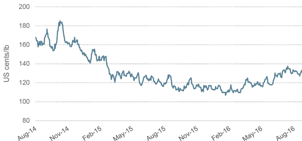
Gráfico 1: Precio indicativo compuesto diario de la OIC

© 2016 International Coffee Organization ( www.ico.org )