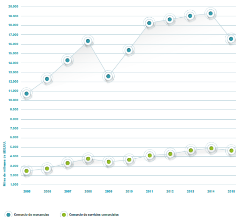
Comercio mundial de mercancías y comercio de servicios comerciales, 2005-2015

El valor del comercio de bienes y servicios descendió en 2015 tras el moderado crecimiento registrado entre 2012 y 2014.