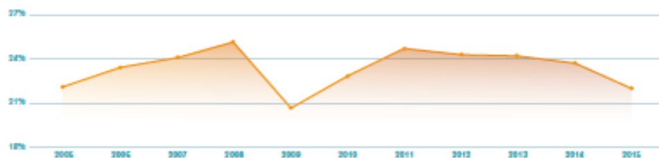
Relación entre el comercio mundial de mercancías y el PIB, 2005-2015

Nota: La relación entre el comercio de mercancías y el PIB es el cociente entre el comercio de mercancías (promedio de los valores de las exportaciones y las importaciones) y el PIB, medidos en millones de dólares nominales a los tipos de cambio del mercado.