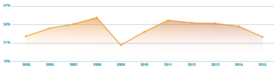
Relación entre el comercio mundial de mercancías y el PIB, 2005-2015

Note: La relación entre el comercio de mercancías y el PIB es el cociente entre el comercio de mercancías (promedio de los valores de las exportaciones y las importaciones) y el PIB, medidos en millones de dólares nominales a los tipos de cambio del mercado.