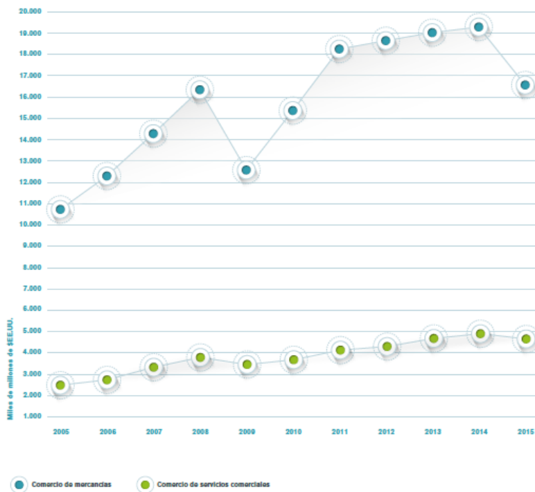
Comercio mundial de mercancías y comercio de servicios comerciales, 2005-2015

El valor del comercio de bienes y servicios descendió en 2015 tras el moderado crecimiento registrado entre 2012 y 2014.