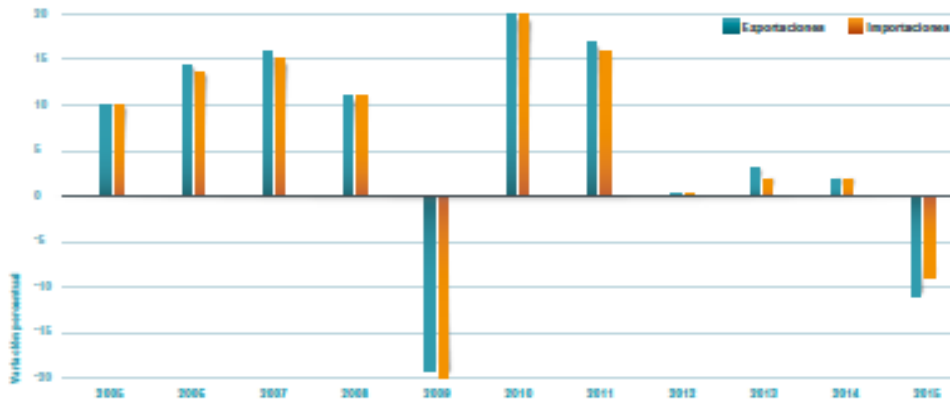
Crecimiento del comercio mundial de mercancías, 2005-2015

La relación entre el comercio de mercancías y el PIB registró una fuerte caída en 2009 a raíz de la crisis económica, pero se recuperó rápidamente en el período 2010-2011. Entre 2012 y 2014 descendió paulatinamente, y en 2015 bajó de forma significativa.